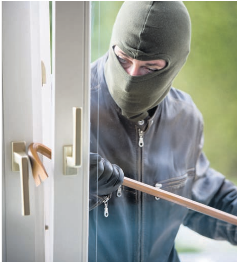
Entgegen dem gängigen Klischee finden die Mehrzahl der Einbrüche nicht nachts statt.

Fenster und Fenstertüren (Balkon- und Terrassentüren): Wenig wählerisch gehen Einbrecher auch bei Fenstern, Balkon- und Terrassentüren