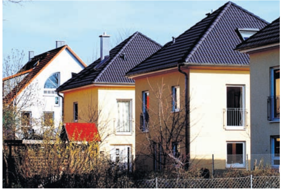
Ein großes Sparpotenzial bei energetischen Maßnahmen bieten Ein- und Zweifamilienhäuser.