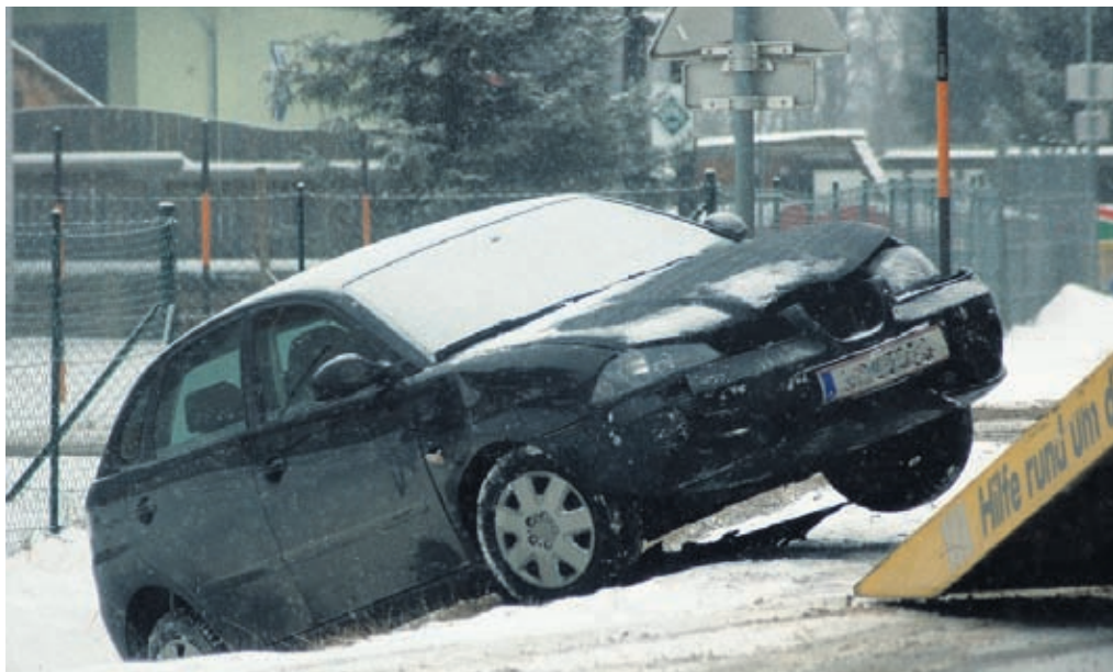
Die Kosten eines Unfalls können steuerlich abgesetzt werden, falls dieser auf dem Weg zur Arbeit passiert ist.

Die Wertminderung ist die Differenz zwischen dem Buchwert des Fahrzeugs vor und dem Verkehrswert nach dem Verkehrsunfall. Des Weiteren gehören zu den absetzbaren Unfallkosten auch Aufwendungen für die Schadensbeseitigung an Gepäck und Kleidung, die Gebühren für einen Mietwagen, solange das eigene Fahrzeug in der Werkstatt ist, und