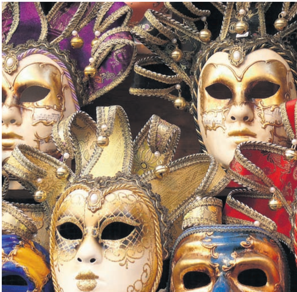
Im 15. Jahrhundert hatte der Karneval seine Fürsprecher in der katholischen Kirche. So erließ Papst Sixtus IV. eine Steuer, um die Karnevalsfeiern zu finanzieren.